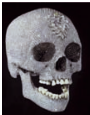
Damien Hirst "For the love of god, the diamond skull" 2007.

Nationalmuseet har gennem længere tid haft omvisningen "Troens billeder" om kristendommens indtog i Danmark, specielt for konfirmander, men nu er Statens Museum for Kunst kommet med hele 4 tilbud som de kalder konfirmandforberedelse. Om Jesu liv, om biblens fortællinger, om liv og død, og om kristne temaer i skulptur og billede.