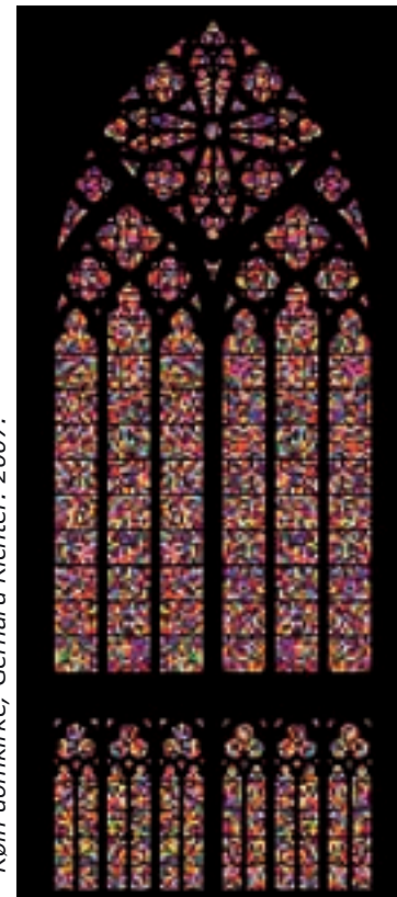
Køln domkirke, Gerhard Richter. 2007.