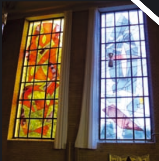
Sorgenfri kirke, Jens Urup