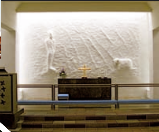
Nærum kirke, Erik Heide