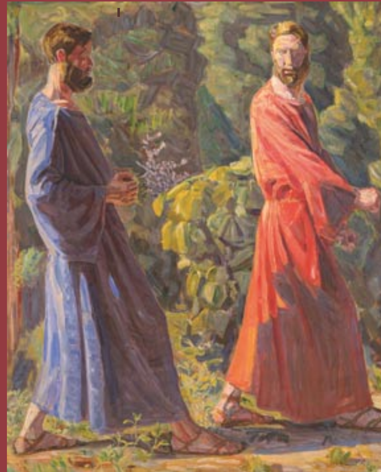
Kristus siger til Peter: "Vig bag mig, satan". 1910. Olie på lærred.

Udstillingen rummer 45 oliemalerier med bibelske motiver, portrætter og landskaber. Desuden vises 60 akvareller og tegninger, der alle er skitser, studier og forarbejder til de 8 hovedværker og til kirkeudsmykningerne. Værkerne er udlånt af private ejere, offentlige institutioner og kunstmuseer i Danmark, Norge og Sverige”.