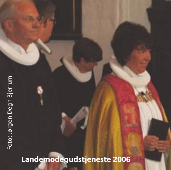
Landemodegudstjeneste 2006