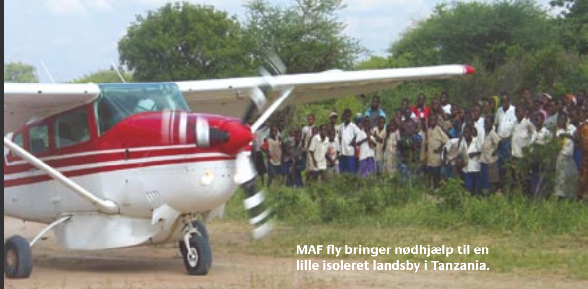
MAF fly bringer nødhjælp til en lille isoleret landsby i Tanzania.

Og så har jeg ikke skrevet meget om formålet med jobbet. Vi er led i en kæde helt tilbage til disciplenes tid. Og budskabet, vi får lov til at bringe, er livsvigtigt. Fantastisk at vi må være med.